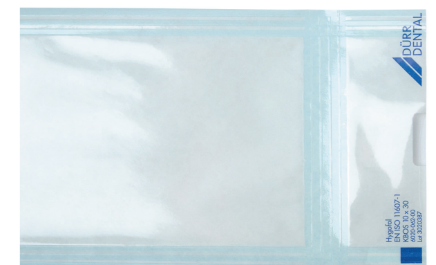
Sterilgutverpackung Hygofol mit sichtbarer 17 mm breiter Siegelnaht für höchste Sicherheit

Dürr Dental bietet Zahnarztpraxen unter der Artikelnummer 0000-500 diesen Siegelnahttest für das Folienschweißgerät Hygopac View als Serviceleistung an. Zum Preis von 118,00 Euro wird die Qualität erneut geprüft und eine Leistungsbeurteilung erbracht - ein wichtiger Baustein für das praxisinterne Qualitätsmanagement.